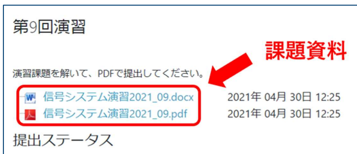
課題の画面上部に表示される課題の資料