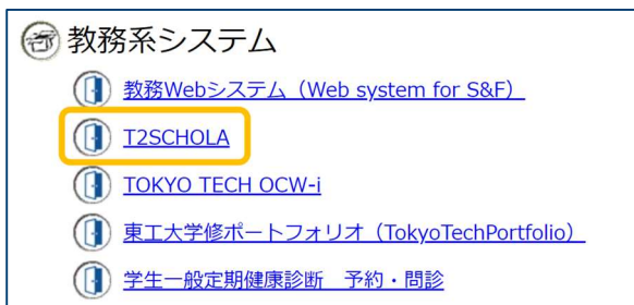
東工大ポータルから T2SCHOLA へアクセスするリンク

T2SCHOLA のスマートフォン向けアプリをご利用の場合は、下記 QR コードから App Store / Google Play へアクセスし、まずはアプリをインストールしておきましょう。アクセスは、東工大ポータルもしくはスマートフォン向けアプリから行えます。