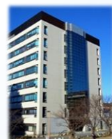
西9号館 コラボレーション ルーム